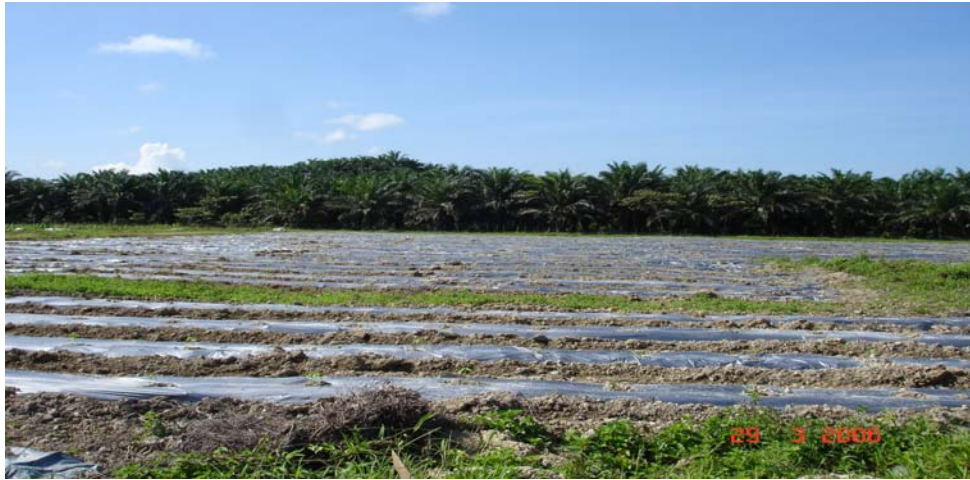
Gambar 1 : Batas untuk tanaman cili burung seluas 12 ekar.