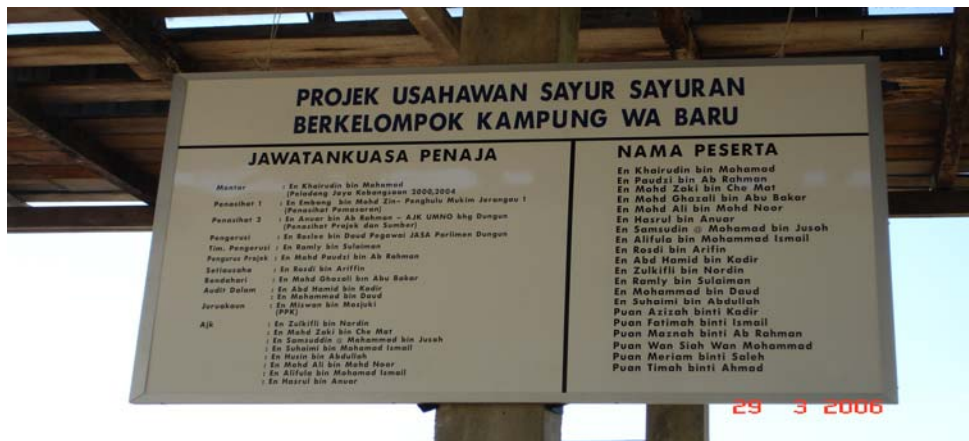
Gambar 5: Peserta projek berkelompok Kg. Wa yang diketuai oleh En. Khairuddin b. Mohamad.