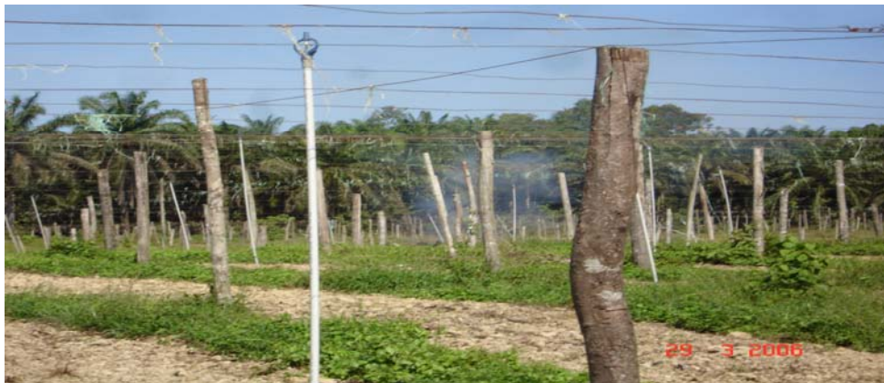
Gambar 7: Para untuk tanaman yang menjalar.