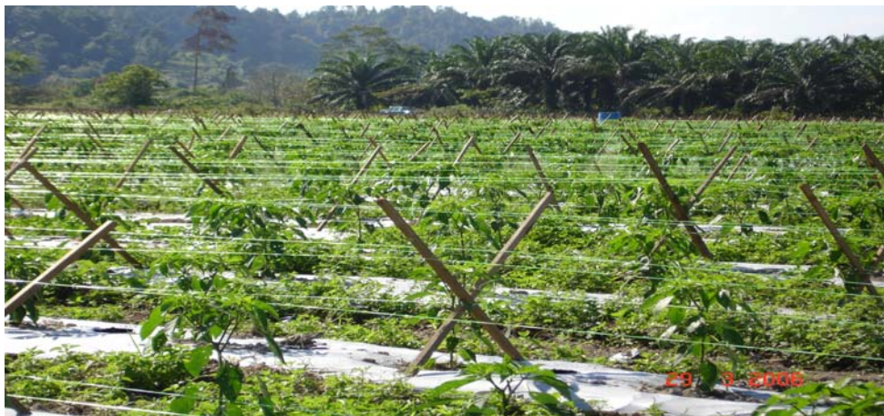
Gambar 2 : Tanaman cili kulai, berusia 2 bulan, seluas 12 ekar di Kg. Wa