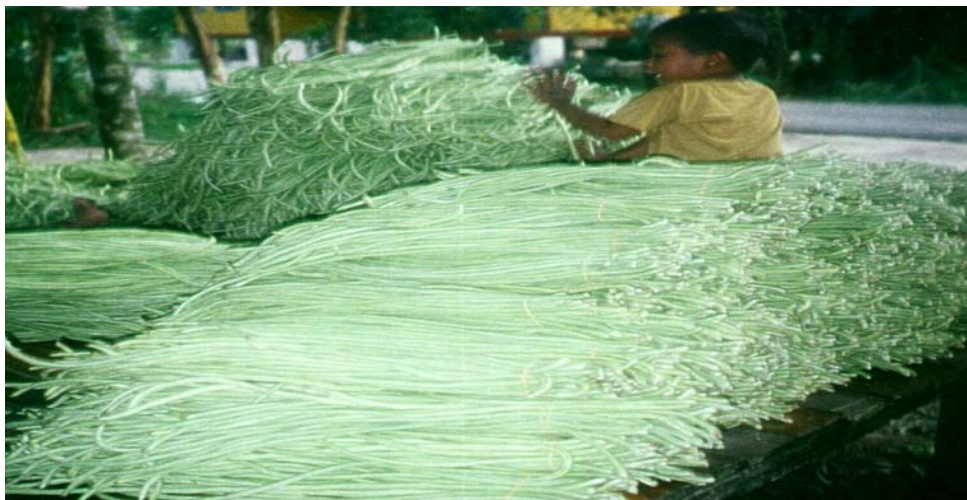
Gambar 9: Hasil sayur kacang panjang yang sedia untuk dijual.