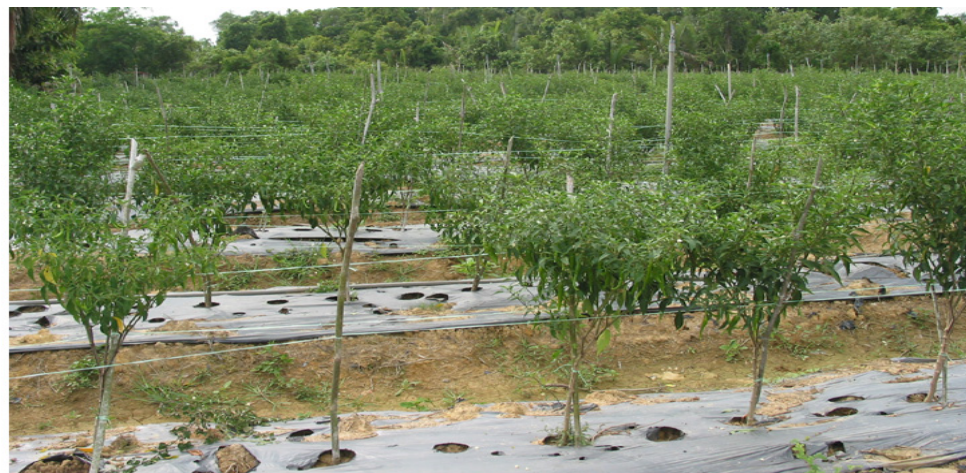
Gambar 3: Pokok cili yang mula mengeluarkan hasil.