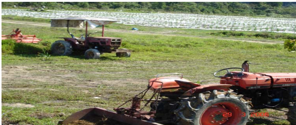
Gambar 6: Jentera pertanian untuk memudahkan kerja di ladang.